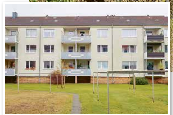
Die Balkone der Häuser Hegebläch 8, 9 und 10 sehen jetzt schick und harmonisch aus (großes Bild). Bis zur Modernisierung waren sie zum Teil unterschiedlich (kleines Bild).

In Garbsen wurden vorbereitende Maßnahmen für ein neues Heizsystem durchgeführt: Das Gebäude am Antareshof 7, das Anfang der 1970er-Jahre gebaut wurde, soll seinen Energiebedarf bald über eine Luft-Wärmepumpe und eine Photovoltaikanlage decken. Im Moment ist dort eine zentrale Gasbrennwertanlage verbaut. Darüber wird das Gebäude beheizt. Warmwasser wird über Durchlauferhitzer erzeugt. Das zweigeschossige Haus, in dem sich insgesamt 14 Seniorenwohnungen befinden, hat ein Flachdach und ist nicht unterkellert. „Es musste für die neue, klimaschonende Energieerzeugung also eine Art ‚Ersatzkeller‘ her, um die gesamte dafür notwendige Technik aufzunehmen“, erklärt Cord Holger Hecht.