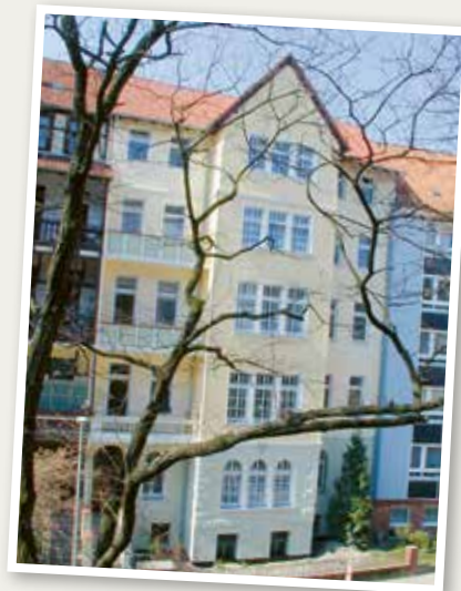
Das erste Bauprojekt des Heimatwerks war der Wiederaufbau des im Krieg beschädigten Wohnhauses in der Jacobsstraße 15.

Deswegen unsere herzliche Bitte an Sie: Kramen Sie doch bei Gelegenheit in Ihren Fotoalben oder Ihrer Erinnerung und halten Sie Ausschau nach Bildern aus „alten Zeiten“ von Ihren Wohnungen, Häusern und Hausgemeinschaften. Wir freuen uns über jedes Foto und jede Geschichte, die uns erreicht und sagen schon jetzt: Herzlichen Dank für Ihre Mithilfe!